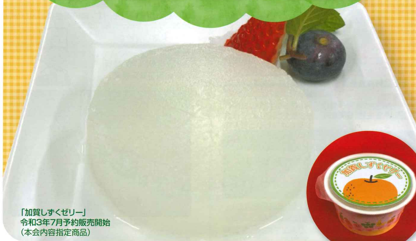
「加賀しずくゼリー」 令和3年7月予約販売開始 (本会内容指定商品)

学校教育活動の一環として位置づけられる学校給食の円滑な実施のため、石川県全域で、その充実・発展に積極的に携わるとともに、学校における食育の推進を支援します。そして、広く児童生徒の心身の健全な発達に寄与することを目的とし、これを達成するため、次の事業を行います。