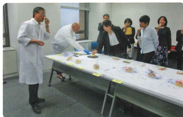
パン品質審査(専門審査員による)