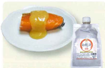
石川県内製造 金沢白菰漬けの素