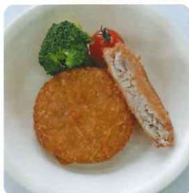
冷凍石川県産 スクールメンチカツFe (キャベツ入り)