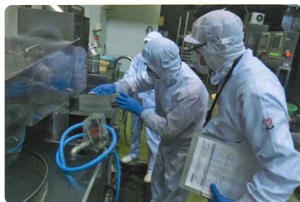
衛生管理調査(専門機関による)