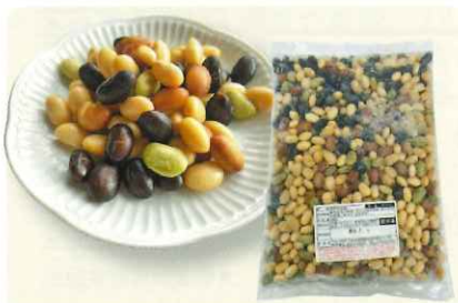
冷凍発芽大豆 (黄・黒・青・赤)