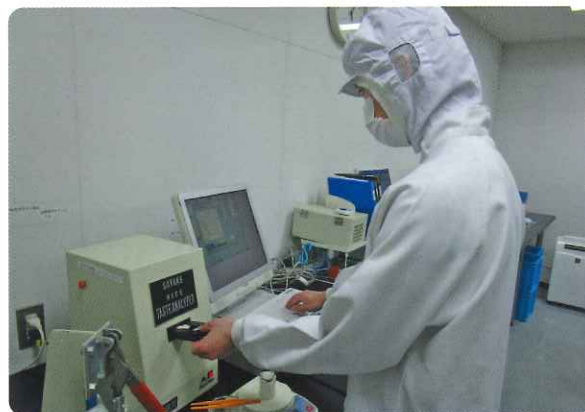
米飯品質検査(専門機関による)