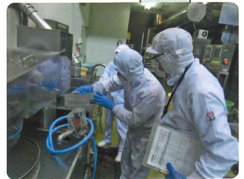
衛生管理調査（専門機関による）