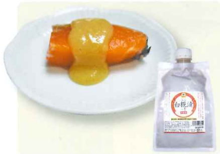
石川県内製造 金沢白糴漬けの素