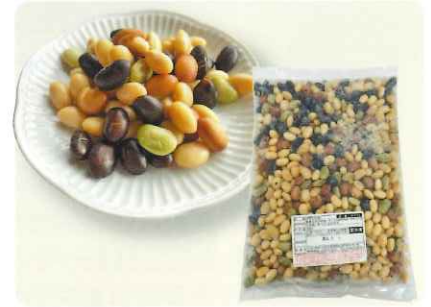
冷凍発芽大豆（黄・黒・青・赤）