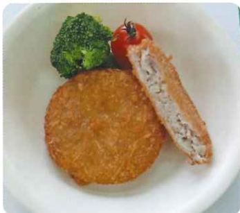
冷凍石川県産スクールメンチカツFe （キャベツ入り）