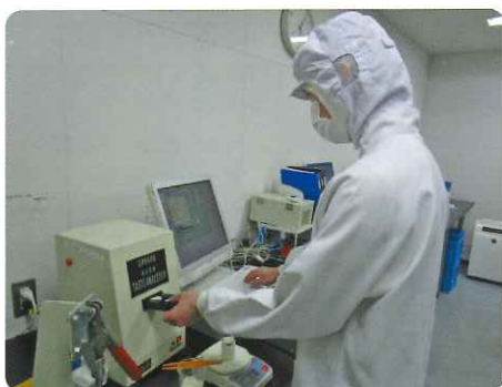
米飯品質検査（専門機関による）