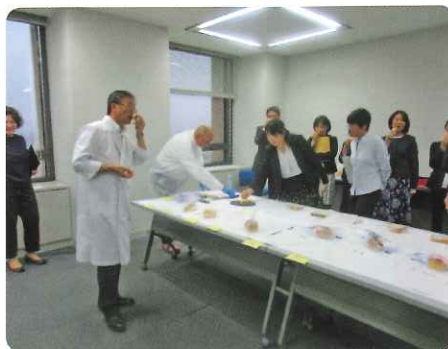
パン品質審査（専門審査員による）