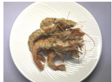
冷凍県産ガスえび唐揚げ