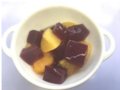
県産ブルーベリーピューレを使ったダイスゼリー