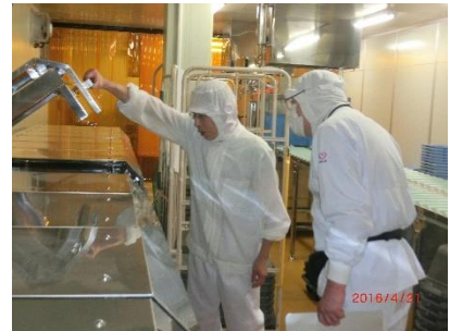
衛生機関による衛生管理調査