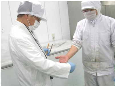
衛生状況調査での拭取り検査