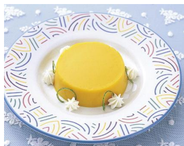
県産かぼちゃプリン