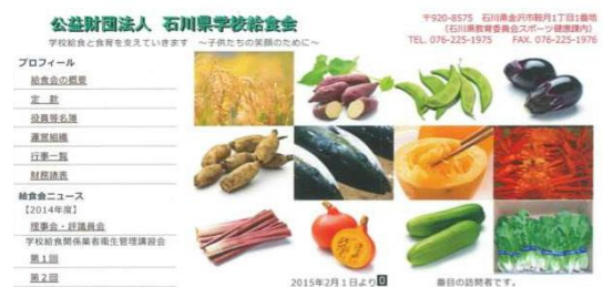
本会のホームページのトップ画面