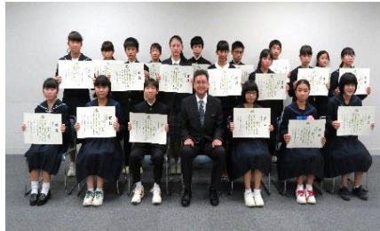
授賞式後の記念撮影